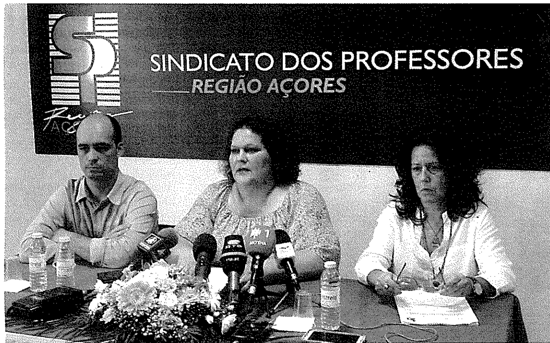
SPRA faz chegar as indignações dos professores da academia ao seu reitor por conferência de imprensa

MIGUEL BETTENCOURT MOTA miguelmota@acorianoriental.pt